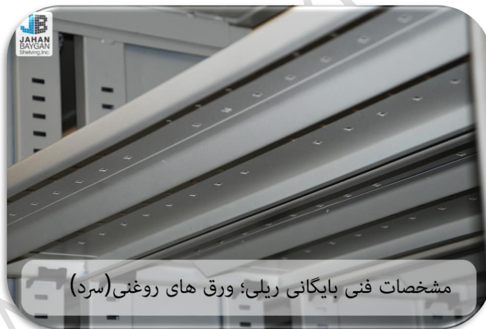
مشخصات فنی بایگانی ریلی؛ ورق های روغنی(سرد)